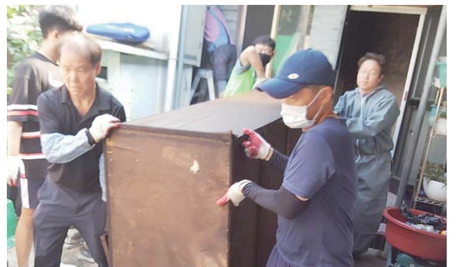
봉사단이 어르신들의 집에 있는 노후화된 주방 기구를 정리하고 있다.