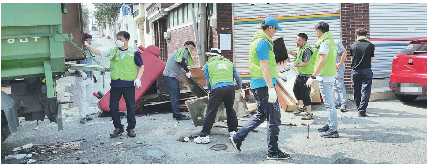
봉사단이 차량을 투입해 쓰레기가 쌓인 주민의 집을 찾아가 대청소를 하고 있다.