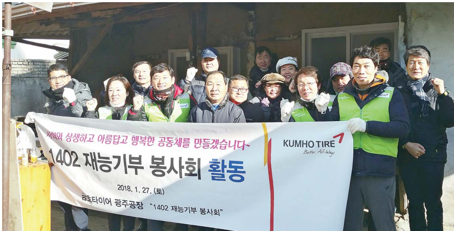
금호타이어 재능기부 봉사단이 소외된 이웃을 직접 찾아가 무료로 가정집을 수리하는 등 봉사활동을 실천하고 있다.

소외된 이웃과 취약계층을 위해 무료 재능기부로 따뜻한 겨울을 준비하고 있는 '금호타이어 재능기부 봉사단'이 눈길을 끌고 있다. 금호타이어 재능기부 봉사단은 2016년 10월 광주시청 및 5개 구청과 업무 협약을 체결해 현재까지 봉사활동을 펼치고 있다. 봉사단은 단장과 팀장, 전기·기계 등 설비분야의 전문가인 사내 기능강사와 현장실무자, 현장관리자, 공장 혁신부서 인원 등 총 56명이 재능기부 봉사를 통해 나눔을 실천하고 있다.